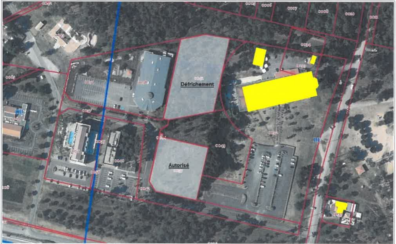
Vue rapprochée avec cadastre